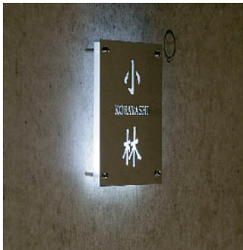
厚さ 12.5mm のスリムなデザイン

厚さわずか 12.5mm のスリムなスタイル/ 特殊な導光板で美しく発光/ サイズ別注、色別注が可能