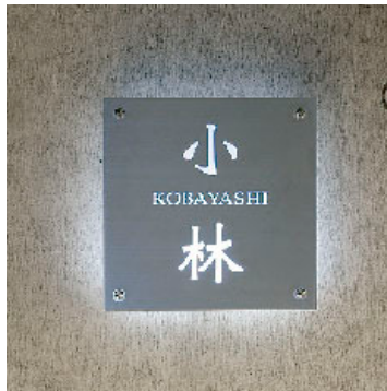
200mm×200mm ステンレス 白色